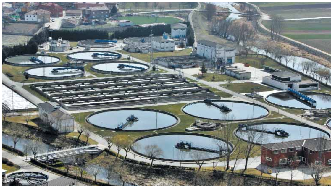
La ampliación de la depuradora es una de las necesidades más urgentes de la ciudad. FOTO: S. O.

De hecho, muchas de ellas, lejos de concluirse, han caído en el saco del olvido. En algunos casos ha sido la falta de viabilidad, como sucedió con la pista de hielo permanente, para la cual Instalaciones Deportivas calculaba unas pérdidas de 14 millones de euros si adjudicaba la explotación a una empresa durante el tiempo de 40 años. Pero en otros ha sido la desidia municipal la culpable de frustrar el proyecto, como sucedió, hace escasos meses, con la residencia de mayores en el S-4 (junto a Villimar). El Ayuntamiento dejó pasar el plazo de entrega del contrato y la empresa adjudicataria, Planiger, renunció a ejecutar la obra y abandonó.